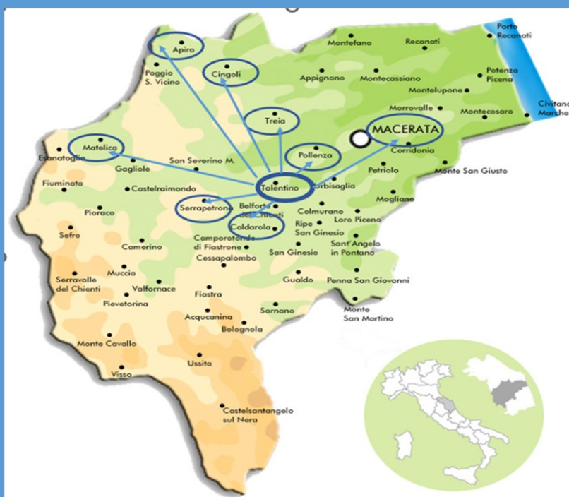
Distribuzione territoriale delle Sedei Operative del Club per l'UNESCO Tolentino Terre Maceratesi ODV