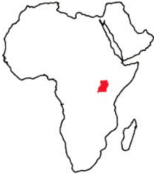
Uganda in Africa